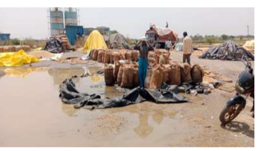
లేదో అన్న ఆందోళన వారిని వెంటాడుతోంది. బస్సెల్లో ఉన్న మొక్కజొన్న మొలకలు వచ్చే ప్రమాదం ఉందని, తక్షణమే తడిసిన ధాన్యాన్ని ప్రభుత్వం కొనుగోలు చేసి అదుకోవాలని రైతాంగం డిమాండ్ చేస్తోంది. అన్ని పరీక్షల్లో చెల్ల, పంటను గట్టికించిన రైతు. వరుణుడి పరీక్షలో ఓడిపోయి దీనస్థితిలో ఉన్నాడు. చేతికొచ్చిన పంట చేజాకోవడం మాడలేక తల్లిదండ్రులను అన్నదాతను అదుకోవడానికి ప్రభుత్వం తక్షణమే స్పందించి, తడిసిన ప్రతి గింజా కొనుగోలు చేసేలా చర్యలు తీసుకోవాలని స్థానిక రైతులు కోరుతున్నారు. లేనివకల్లో రైతు పూర్వం కోలుకోలేని దెబ్బతింటుందని వారు ఆవేదన వ్యక్తం చేస్తున్నారు.