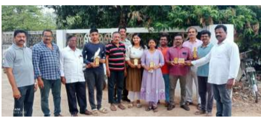
వివేకానంద కాలనీలో ప్రతిభావంతులైన విద్యార్థులకు సత్కారం ఈ సంవత్సరం టెన్ ఆలోగ్ ఇంటర్ పరీక్షల్లో ఉత్తమ ప్రతిభ కనబరిచి మంచి మార్కులతో ఉత్తీర్ణత సాధించిన విద్యార్థులను

ప్రోత్సహించే ఉద్దేశ్యంతో, వివేకానంద కాలనీ వాసుల ఆధ్వర్యంలో ఆదివారం ప్రత్యేక సత్కార కార్యక్రమం ఘనంగా నిర్వహించబడింది. కాలనీకి మంచి పేరు తీసుకొచ్చిన విద్యార్థులను కాలనీ పెద్దలు, యువత మరియు వాసులు అభినందించి సత్కరించారు. విద్యార్థులు భవిష్యత్తులో మరింత ఉన్నత స్థాయికి ఎదగాలని ఆశీర్వాదించారు. ఈ కార్యక్రమంలో కాలనీ వాసులు పెద్ద సంఖ్యలో పాల్గొని విద్యార్థులను అభినందించడం విశేషం. సమాజ అభివృద్ధికి విద్య ఎంతో ముఖ్యమని, ఇలాంటి కార్యక్రమాలు విద్యార్థుల్లో మరింత ఉత్సాహాన్ని పెంపొందిస్తాయని పలువురు అభిప్రాయపడ్డారు. ఈ కార్యక్రమాన్ని విజయవంతం చేసే కాలనీ వాసులకు నిర్వాహకులు కృతజ్ఞతలు తెలిపారు.