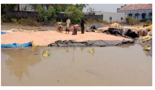
తిరుగుతూనే ఉన్నారు. సరిపడ గోనె సంఘం లీకపోవడం, లారీలు రాకపోవడంతో ఆశాంశం కింద కుప్పలు పోసి ధాన్యాన్ని ప్రభుత్వం కొనుగోలు చేసి అదుకోవాలని రైతాంగం డిమాండ్ చేస్తోంది. అన్ని పరీక్షల్లో చెల్ల, పంటను గట్టికించిన రైతు. వరుణుడి పరీక్షలో ఓడిపోయి దీనస్థితిలో ఉన్నాడు. చేతికొచ్చిన పంట చేజాకోవడం మాడలేక తల్లిదండ్రులను అన్నదాతను అదుకోవడానికి ప్రభుత్వం తక్షణమే స్పందించి, తడిసిన ప్రతి గింజా కొనుగోలు చేసేలా చర్యలు తీసుకోవాలని స్థానిక రైతులు కోరుతున్నారు. లేనివకల్లో రైతు పూర్వం కోలుకోలేని దెబ్బతింటుందని వారు ఆవేదన వ్యక్తం చేస్తున్నారు.