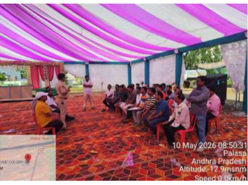
పోలీసులు దొంగలను పట్టుకున్న పోలీసులు పట్టుకున్నారు. శనివారం జరిగిన దొంగ తనము అలాగే కొత్త రకము క్రైమి పెరుగుదల వల్ల దొంగలను పట్టుకొని సన్మానాలు చేస్తున్నారు పోలీస్.. ఇటీవల కాశీబుగ్గ జిఎంఇ కాలనీ ఒక ఇంటిలో దొంగతనం జరిగింది. ఆ కాలనీ లో సీసీ కెమెరాలు లేకపోవడం వలన దొంగతనం చేసిన వారిని గుర్తించడం అవ్వలేదు. అందుకు