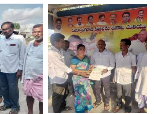
ముఖ్యమంత్రి సహాయ నిధి నిరుపేదలకు వరంలాంటిది