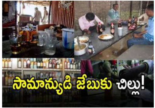
సామాన్య డి జేబుకు చిల్లు!

మన ప్రజావాణి/భద్రాద్రి జిల్లా బ్యారో (మే 05): భద్రాద్రి కొత్తగూడెం జిల్లాలో మద్యం సిండికేట్ దండంపై అరోపణలు రోజురోజుకూ తీవ్రమవుతున్నాయి. జిల్లాలో రోజురోజుకూ అక్రమంగా ఏర్పాటుచేసిన బెల్ట్ షాపుల సంఖ్య భారీగా పెరుగుతుండటం, అక్రమ మద్యం విక్రయాలు విస్తరించడం, స్థానికుల్లో ఆందోళన కలిగిస్తోంది. అధికార యంత్రాంగం నియంత్రణ చర్యలు తీసుకుంటున్నట్లు చెబుతున్నప్పటికీ, ప్రత్యక్షంగా పరిస్థితులు పూర్తిగా విరుద్ధంగా ఉన్నాయి. గ్రామీణ, గిరిజన ప్రాంతాల్లో మద్యం విక్రయాలపై పర్యవేక్షణ లోపించడం వల్ల బెల్ట్ షాపులు విస్తృతంగా పెరిగిపోయాయి. ముఖ్యంగా చుంచపల్లి, సుజాత నగర్, ములకలపల్లి, దమ్మపేట, లక్ష్మీదేవిపల్లి, పాల్వంచ రూరల్ మండలాల్లో అధికారిక మద్యం దుకాణాల సంఖ్య తక్కువగా ఉండటంతో అక్రమ విక్రయాలే అధిపత్యం కొనసాగుతోంది. కొన్ని ప్రాంతాల్లో పూర్తిగా బెల్ట్ షాపులపైనే మద్యం సరఫరా ఆధారపడుతున్న పరిస్థితి నెలకొంది. పాఠశాలలు, ఆంగన్వాడీలు, దేవాలయాలు, ఆసుపత్రుల సమీపంలో కూడా మద్యం విక్రయాలు భారీగానే జరుగుతున్నాయనే అరోపణలు వినిపిస్తున్నాయి. చిన్నారులు, యువత ఈ వాతావరణానికి గురవుతుండటం భవిష్యత్తుకు ముప్పుగా మారుతుందనే ఆందోళన వ్యక్తమవుతోంది. సామాజిక సంస్థలు, మహిళా సంఘాలు ఈ అంశంపై తీవ్రంగా స్పందిస్తూ, గ్రామీణ కుటుంబాలపై మద్యం ప్రభావం పెరుగుతోందని హెచ్చరిస్తున్న కానీ, బెల్ట్ షాపుల్లో మద్యం విక్రయాలు జరుగుతున్నాయి. ఒక్కో బాటిల్పై 50 నుండి 60 రూపాయలు అదనపు ధరలు వసూలు చేస్తూ, విద్యార్థులకు దోచుకుంటున్నారని అరోపణలు ఉన్నాయి. కొందరు వ్యాపారులు మార్కెట్లో కొన్ని ట్రాండ్ల కొరత సృష్టించి,