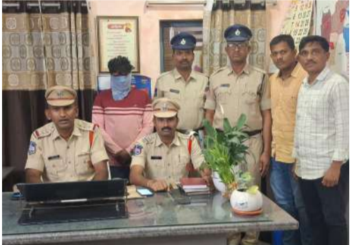
లిమాండ్ కు తరలింపడైనది. నిందితుని వద్దనుండి 3 తులాల బంగారు తాడు, 2 గ్రాముల బంగారు చెవి కమ్మలు, 20 వెండి కాళ్ళ పట్టీలు రికవరీ చేయడం.